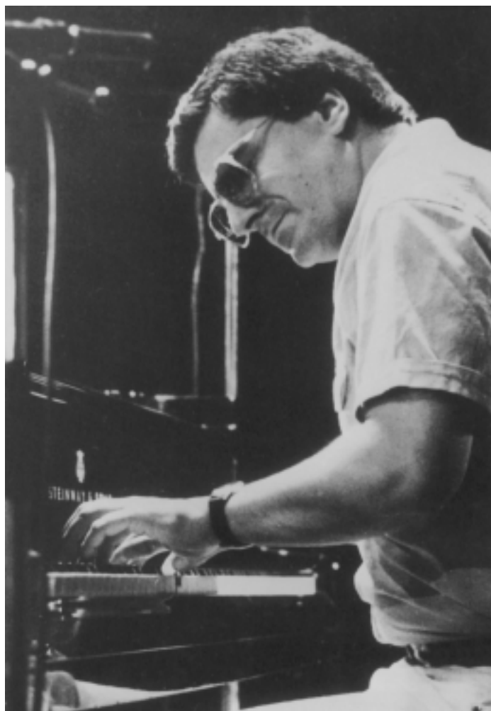
Enrico Pieranunzi in Neuburg, Neu-Ulm und München.

E nrico Pieranunzi, der am 19.9. in der Unterfahrt, am 21. September um 20.30 Uhr im „Birdland“ Jazzclub in Neuburg und am 22.9. in der Musikschule Neu-Ulm die Hörer mit seinem feinnervigen Spiel beglücken wird, erblickte am 5.12.1949 in Rom das Licht der Welt, um schon im zarten Alter von fünf Jahren die schwarzen und weißen Tasten für sich zu entdecken. Da sein Vater Alvaro Gitarrist mit